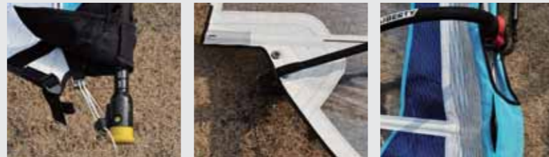
マストを通しダウンを70%位引く アウトを引く ジッパーを開けてカムを入れる

LX SLALOM Ⅲ (カムは後入れ) マストをスリーブに通した後、ジッパーを開けてカムを下から順番に入れて、ジッパーを閉じる。