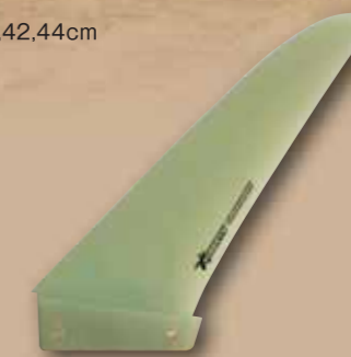
G10 WEED FIN BOX：US BOX、タートル、パワー