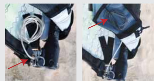
シートをクリートの横から通して丸める 丸めたシートをポケットに入れる。いつでも簡単にシートを取り出しダウンの調整ができる。